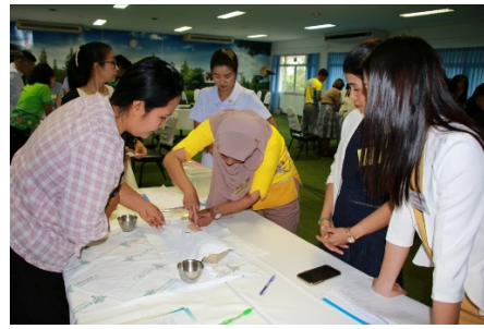
การฝึกปฏิบัติกับหุ่นจำลอง