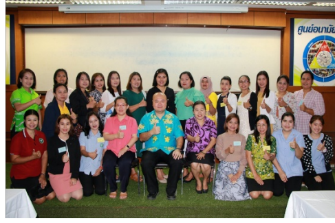
การอบรมภาคทฤษฎีการให้บริการฝังยาคุมกำเนิด