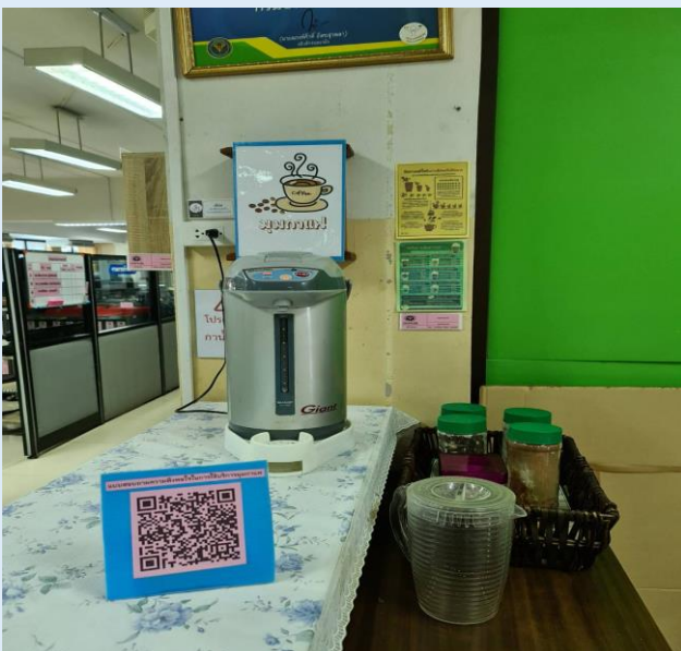
ประเภทผู้ใช้บริการมุมนกาแฟ ตัวอย่าง 50 ข้อ