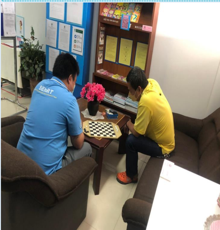
ประเภทผู้ใช้บริการมุมสนทนาการ จำนวน 43 ข้อ