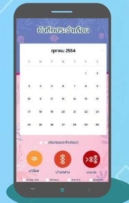
บันทึกประจำเดือน