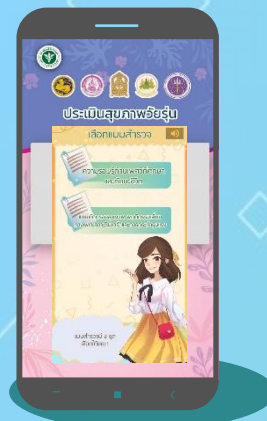
ประเมินสุขภาพวัยรุ่น