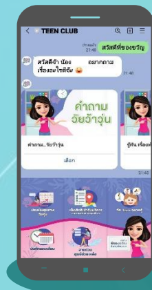
คุยกับพี่ของวัยรุ่น