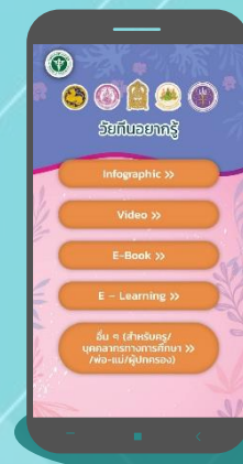
วัยรุ่นอยากรู้