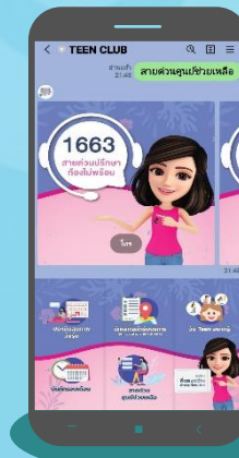
สายด่วนศูนย์ช่วยเหลือ